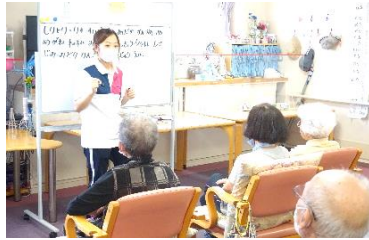
↑食後の脳トレ。 →壁画作成♪ しりとりに♪