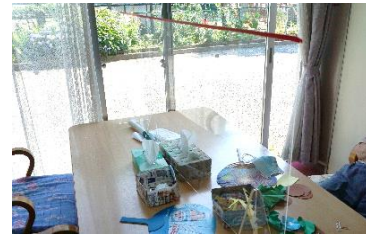
←アクリル板を使用し、 コロナ対策を 行っています。